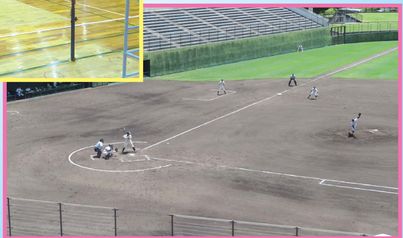
東信地区予選 (県営上田野球場)

上田市スポーツ少年団は随時団員を募集しています。 スポーツの力で地域に元気・活気を取り戻そう!!