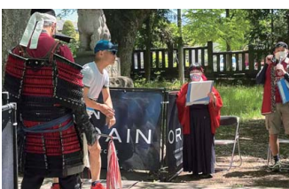
大星神社の赤鳥居前を10秒ごとにスタートする選手