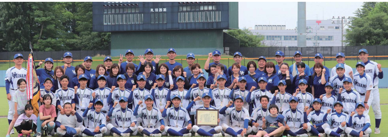
上田南リーグスポーツ少年団

発行/(一財)上田市スポーツ協会 〒386-1101 上田市下之条354-1 上田古戦場公園管理事務所(県営上田野球場内) 電話 0268 (27) 9400 FAX 0268 (21) 3100 Email:taiky@po2.ueda.ne.jp 編集/総合企画委員会 印刷所/田口印刷株式会社