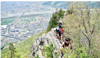
2日目のスカイレース 岩場の兎峰を通過する選手たち