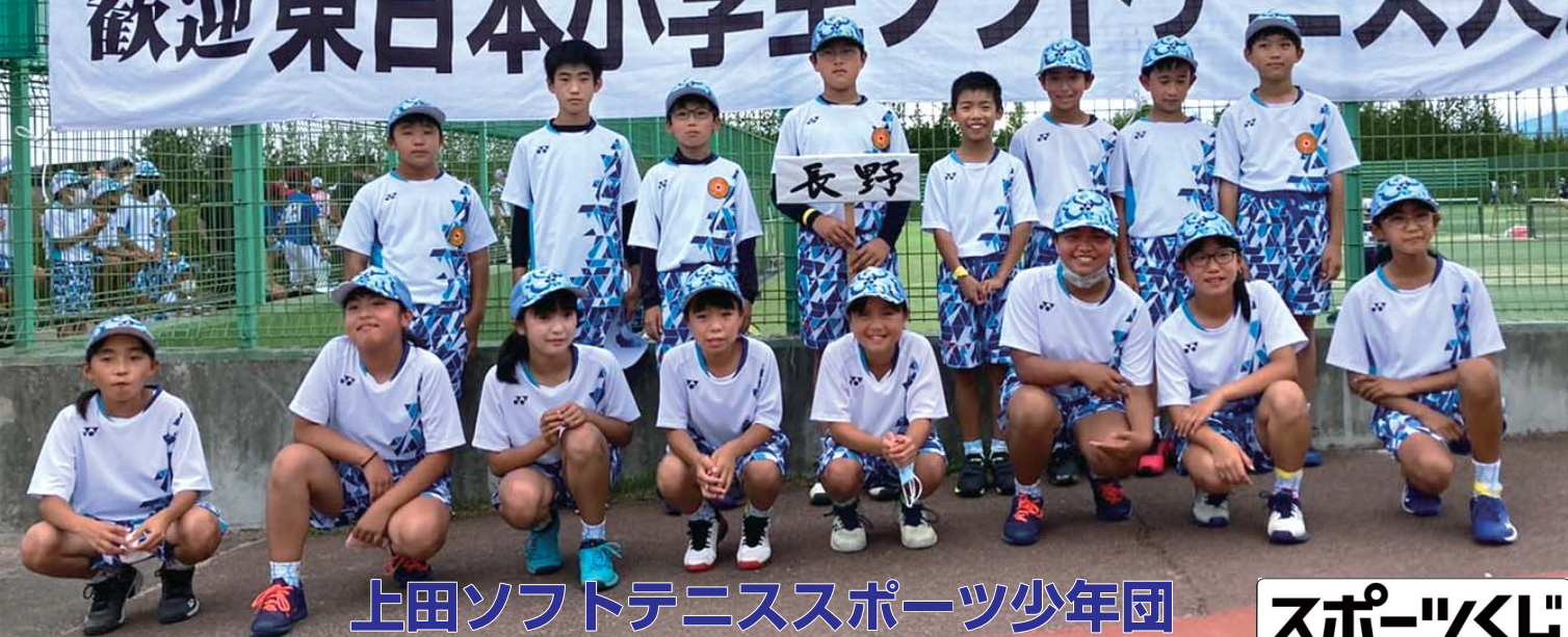
上田ソフトテニススポーツ少年団