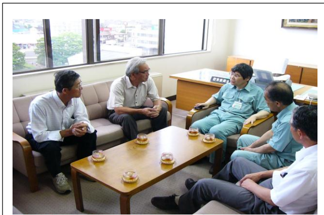
丸山教育長から被災状況の説明