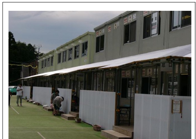
テニスコートに建てられている町役場仮庁舎