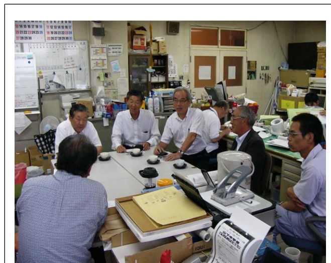
教育委員会で復旧状況の説明を聞く