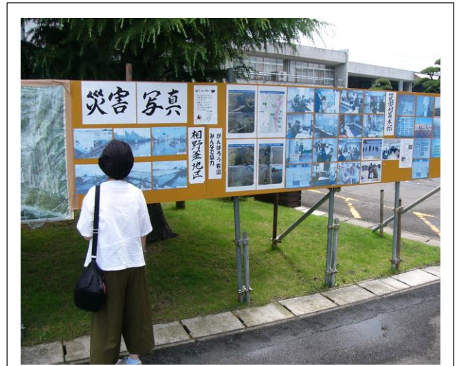
市役所前に設置してある被害写真