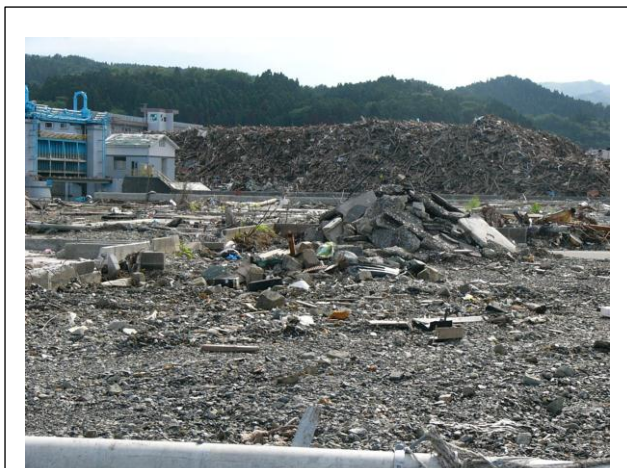
20m 近く積み上げられたがれき